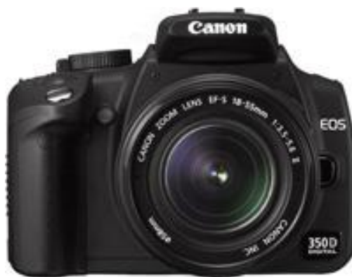
Рисунок 2 - Canon EOS 350D